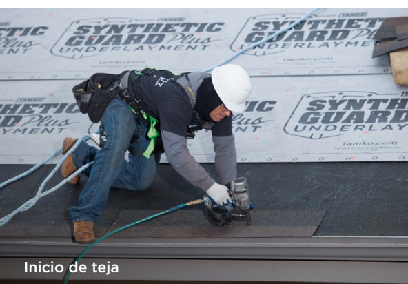
Inicio de teja