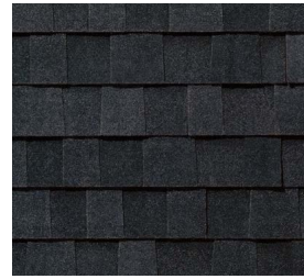
Titan XT® Rustic Black

Las tejas de tres lengüetas realzan los hogares con un estilo versátil, colores vibrantes y un toque distintivo.