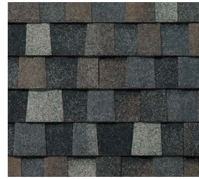
StormFighter FLEX® Thunderstorm Grey