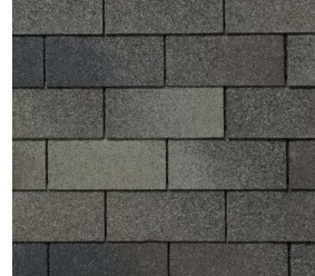
Elite Glass-Seal® Oxford Grey

* Consulte la garantía limitada de TAMKO® y las instrucciones de instalación para conocer todos los requisitos y limitaciones.