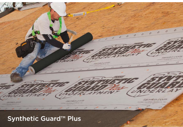
Synthetic Guard ™ Plus