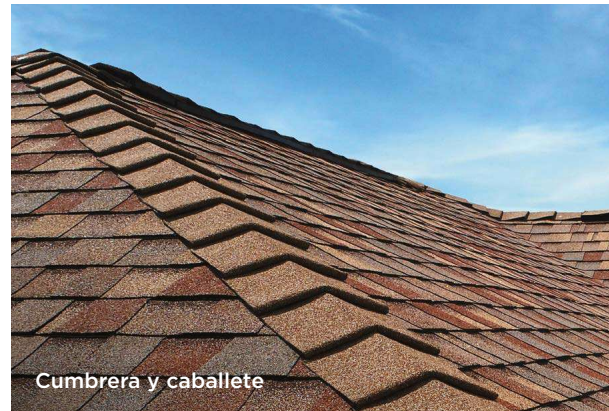
Cumbrera y caballete

La ventilación inadecuada es una de las principales causas de diversos problemas en el techo, incluido el envejecimiento prematuro de las tejas. Bríndele a su techo el acabado ventilado que necesita, con una selección de respiraderos de cumbrera en formato seccional o en rollo, diseñados para favorecer una ventilación adecuada y prolongar su rendimiento.