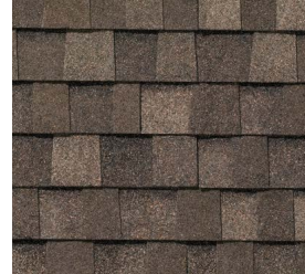
Heritage® Weathered Wood